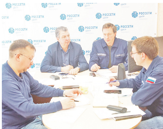
В Конаковском округе справились с авариями на электросетях ..... 3