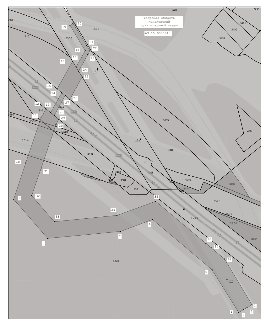
Схема расположения границ публичного сервитута для использования земель и земельных участков в целях реконструкции и эксплуатации объекта электросетевого хозяйства регионального значения: электросетевого комплекса «ВЛ-110 кВ «Тверь-Редкино» с линиями электропередачи: «ВЛ-110 кВ Калининская-Редкино I цепь с отпайками», «ВЛ-110 кВ Калининская-Редкино II цепь с отпайками», «ВЛ-110 кВ Калининская-Редкино ПГВРОЗ», кадастровый номер: 69:15:0160101:44 (реконструируемые участки, входящие в состав электросетевого комплекса: ВЛ 110 кВ Калининская - Редкино 1, 2 цепи с отп. ПС Глазково, ПС Химзавод)

Условные обозначения: 1 - Проектные границы публичного сервитута и характерные точки 2 - Проектное местоположение инженерного сооружения 3 - Граница земельных участков, сведения о которых содержится в ЕФРН 4 - Кадастровый номер земельного участка 5 - Граница кадастрового квартала 6 - Номер кадастрового квартала 7 - Граница административно-территориального образования 8 - Наименование административно-территориального образования