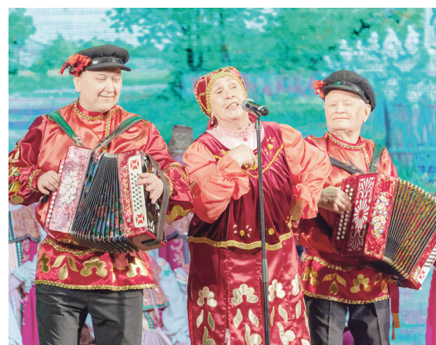
Фестиваль «Играй, гармонь, над Волгой» прошел в Конаково ..... 11