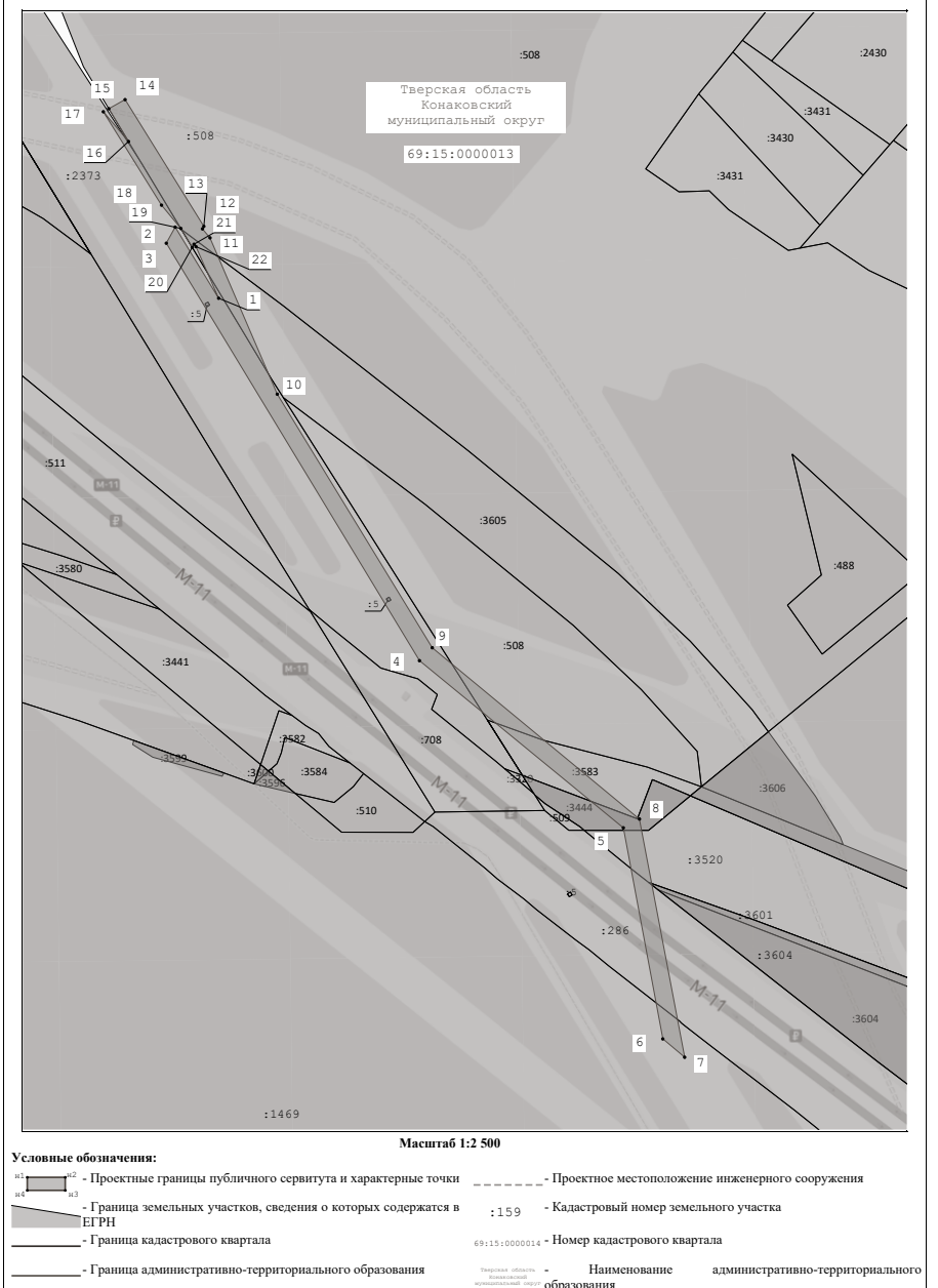
Схема расположения границ публичного сервитута для использования земель и земельных участков в целях реконструкции участков инженерного сооружения, являющегося линейным объектом: электросетевого комплекса «ВЛ-110 кВ «Тверь-Редкино» с линиями электропередачи: «ВЛ-110 кВ Калининская-Редкино I цепь с отпайками», «ВЛ-110 кВ Калининская-Редкино II цепь с отпайками», «ВЛ-110 кВ Редкино-Редкинская ПГВРОЗ», кадастровый номер: 69:15:0160101:44 (реконструируемые участки, входящие в состав электросетевого комплекса: ВЛ 110 кВ Калининская - Редкино 1, 2 цепи с отп. ПС Глазково, ПС Химзавод)