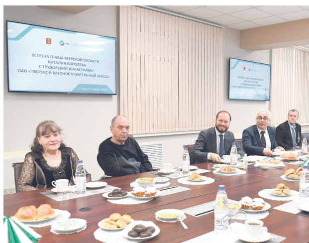
Тверская губерния: Завод – это люди, традиции и технологии ..... 2